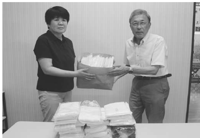
大崎地区退職校長会玉造支会 様